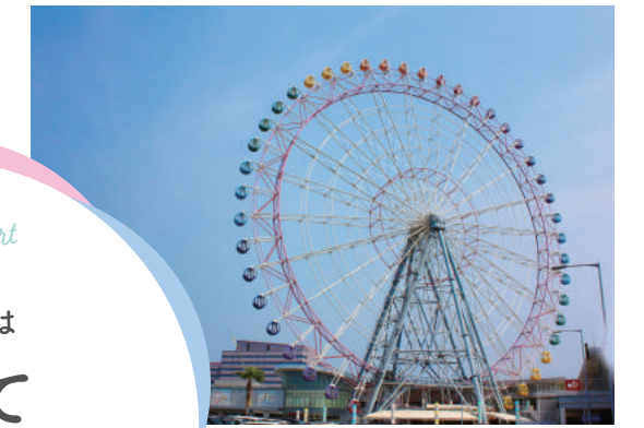
りんくうプレジャータウンシークル

「りんくうタウン」は家族でいきやすい人気のお出かけスポット。西日本最大級のアウトレット「りんくうプレミアム・アウトレット」や、隣接する「りんくうプレジャータウンシークル」では、買い物、食事、温泉まで楽しめます。海や景色を楽しめる「りんくう公園」、松林と白い大理石を敷き詰めたロングビーチ「りんくうマーブルビーチ」では、観覧車や飛行機を眺めながらリゾート気分を満喫できます。