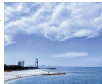
りんくうマーブルビーチ

瀬戸内式気候に属するため気候は温暖で、比較的少ない降水量となっています。自然災害も少ない地域となっています。